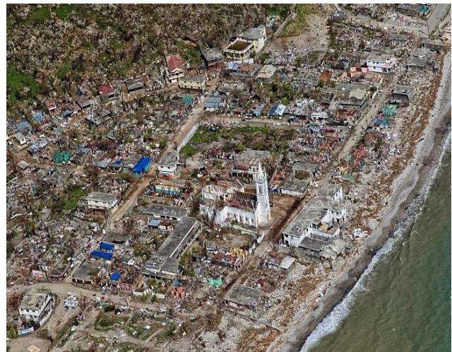
80% der Häuser der Stadt Jérémie und 90% derjenigen von Port-à-Piment wurden beschädigt oder zerstört