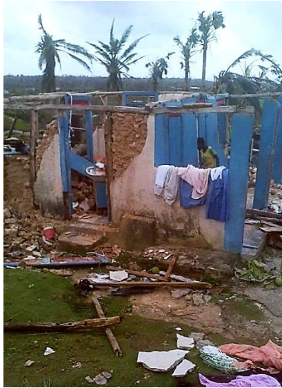
Einfache Landhäuser konnten der Wucht der Winde nicht widerstehen