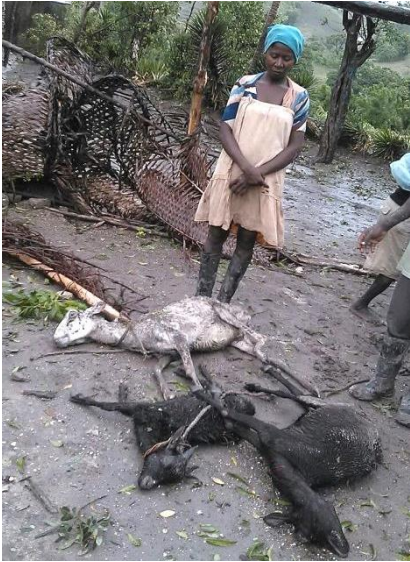
In den ländlichen Gebieten ist der Verlust an Tieren (=Bank) enorm